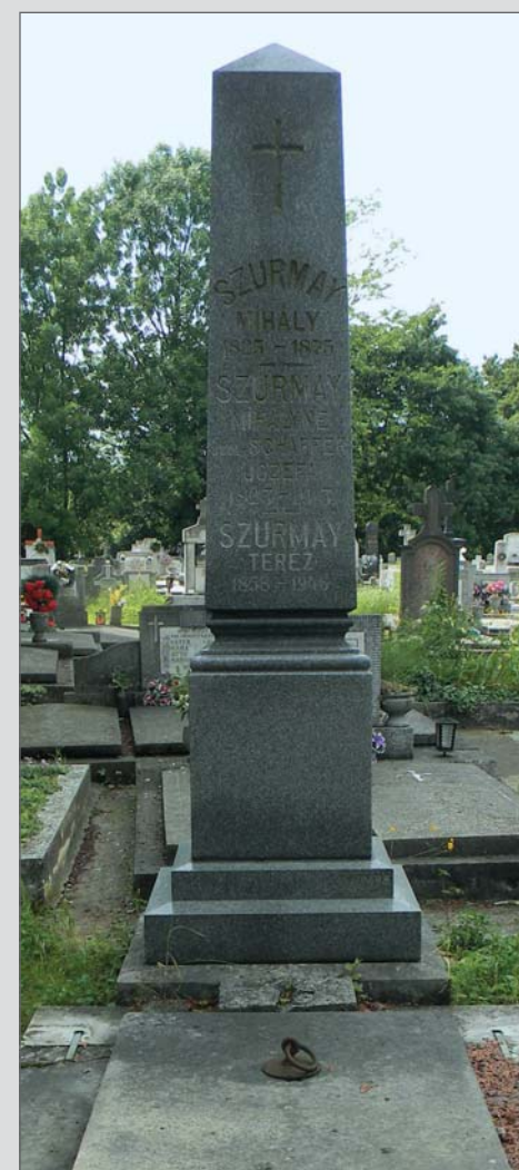
A család síroszlopa Boksánbányán (Románia), a katolikus temetőben.